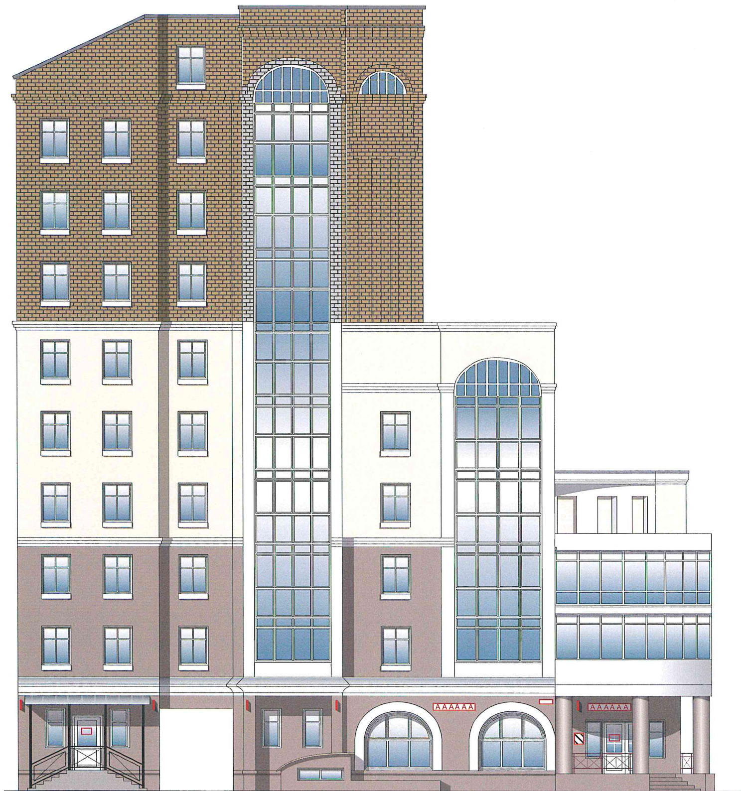
Схема возможных мест размещения информационных конструкций (вывесок), информационных табличек, указателей и витрин, входных групп и их отдельных элементов с условными обозначениями и размерами: