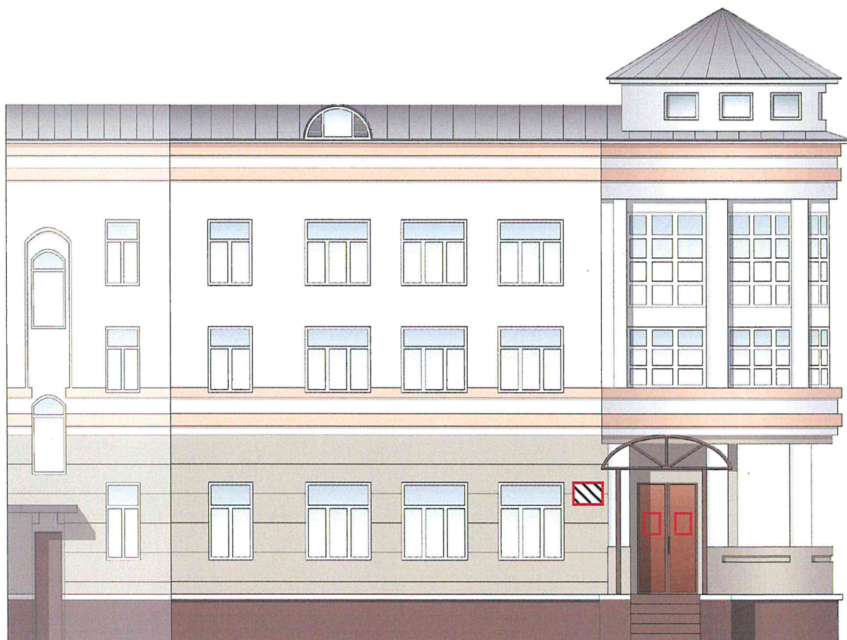
Схема возможных мест размещения информационных конструкций (вывесок), информационных табличек, указателей и витрин, входных групп и их отдельных элементов с условными обозначениями и размерами: