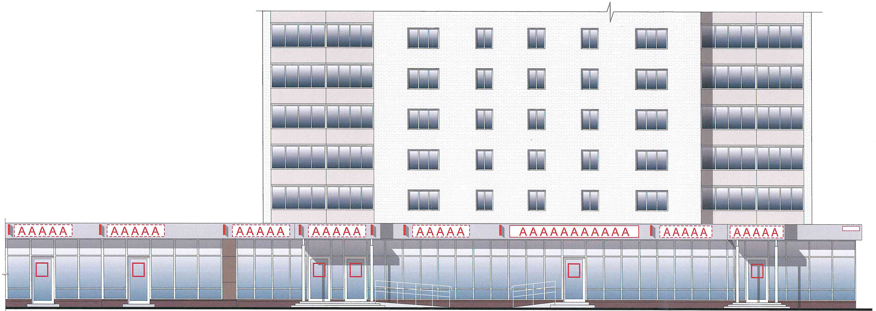
Схема возможных мест размещения информационных конструкций (вывесок), информационных табличек, указателей и витрин, входных групп и их отдельных элементов с условными обозначениями и размерами: