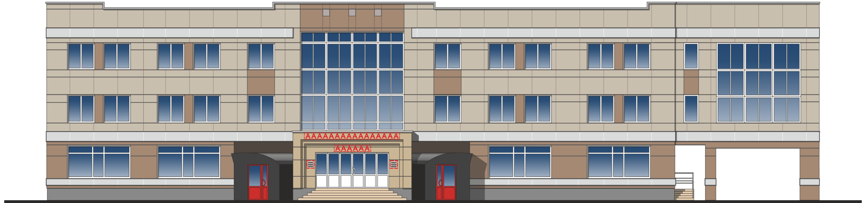
Схема мест размещения информационных конструкций (вывесок), информационных табличек, указателей и витрин, входных групп и их отдельных элементов