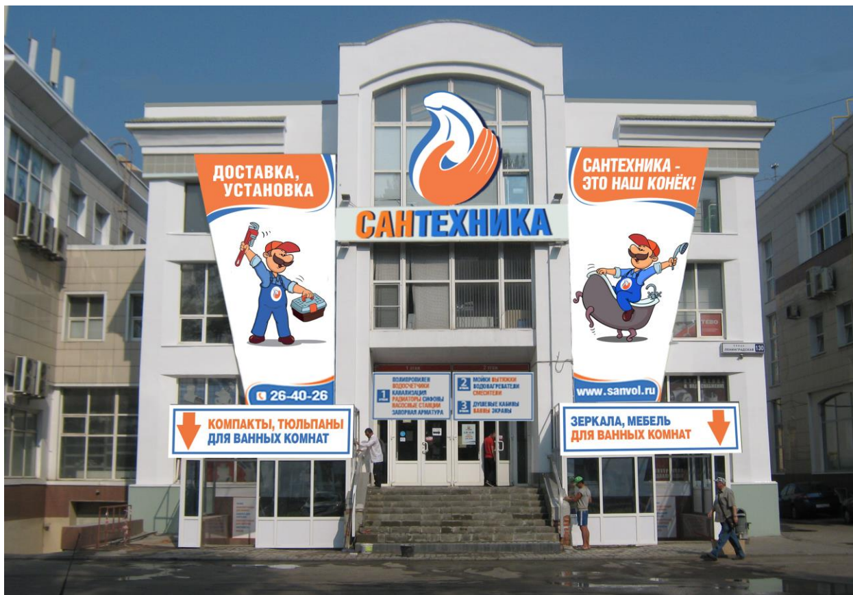
Фотографии фактического состояния фасада (на 06.08.2017)