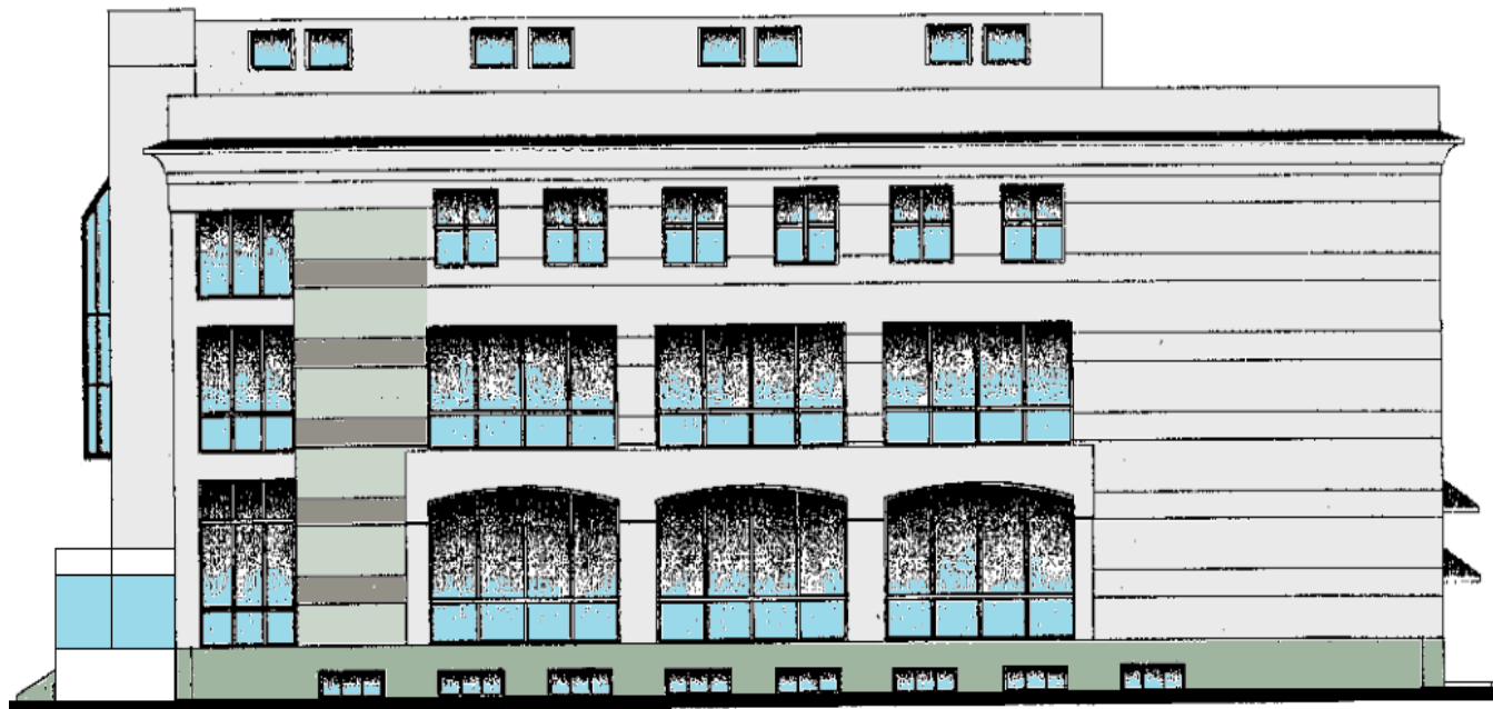
Боковой фасад по ул. Ленинградская