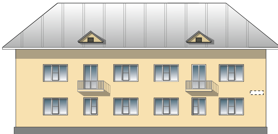
Схема возможных мест размещения информационных конструкций (вывесок), информационных табличек, указателей и витрин, входных групп и отдельных элементов с условными обозначениями и размерами: