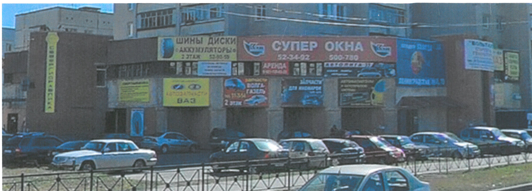
Фактическое состояние фасада на настоящий момент 16.08.2016