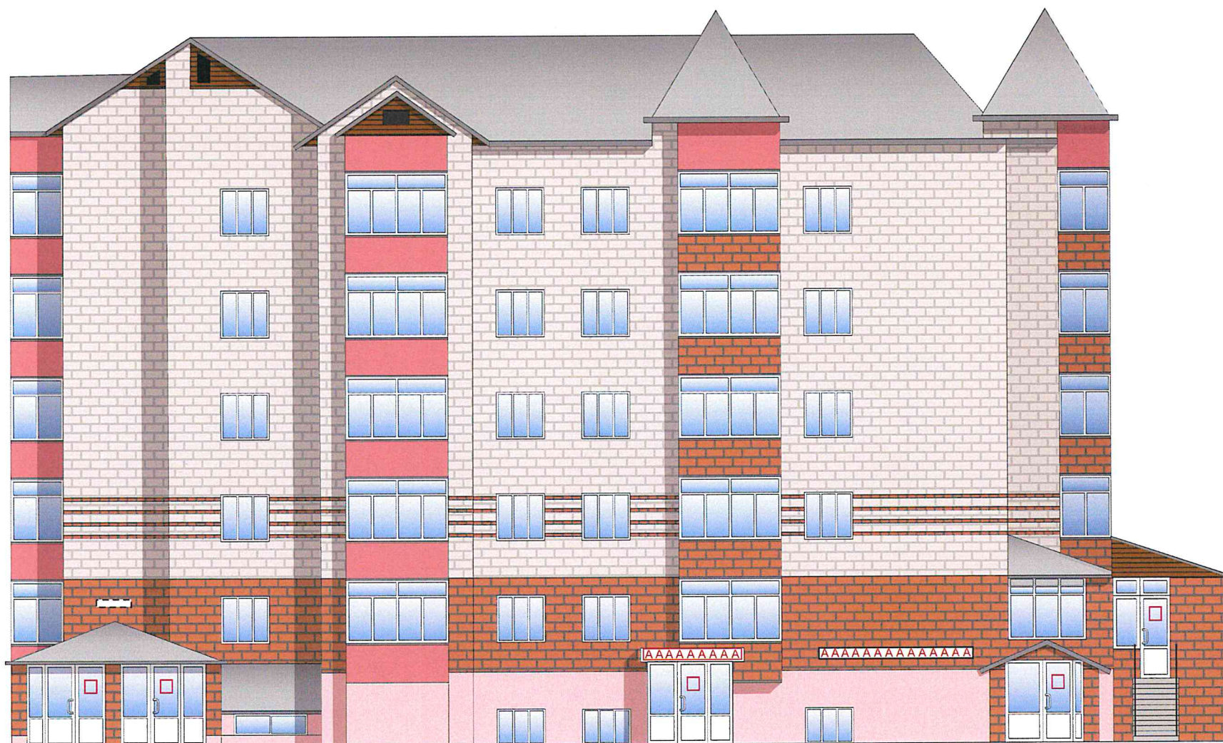
Схема возможных мест размещения информационных конструкций (вывесок), информационных табличек, указателей и витрин, входных групп и их отдельных элементов с условными обозначениями и размерами: