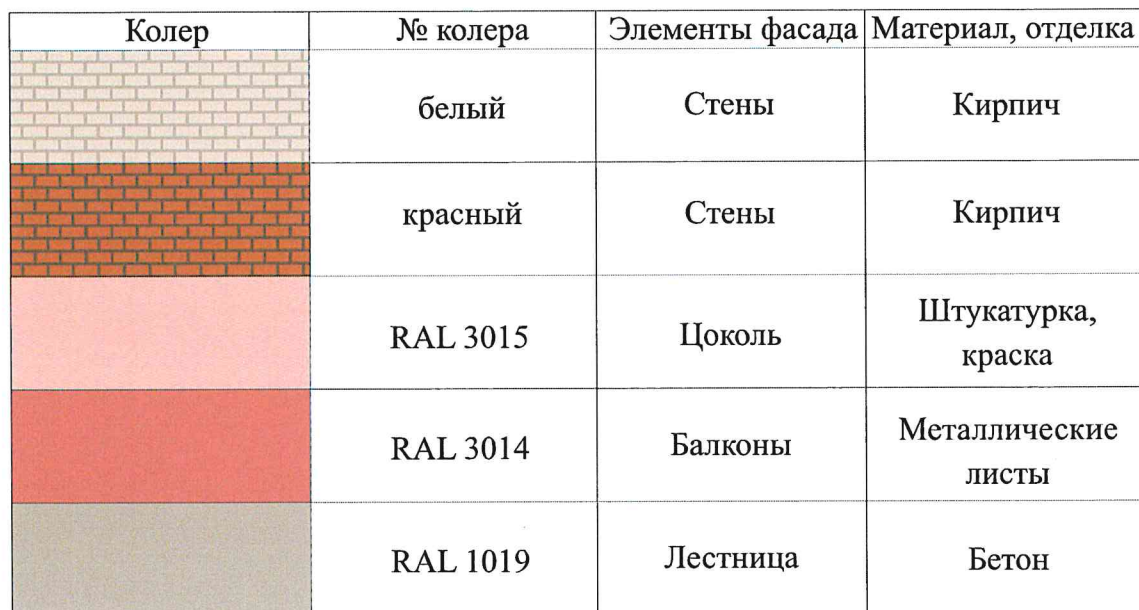
Таблица расколеровки элементов с эталонами колеров

Примечание: колер по каталогу Tikkurila RAL Classic